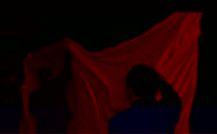
圖為教育學院校史博覽會現場。

教育學院校史博覽會，展示了教育學院的歷史發展和成就。展覽內容豐富，包括歷史照片、文件和实物。參觀者對學院的發展歷程表示讚賞，並對學院在教學和科研方面的卓越成就表示欽佩。